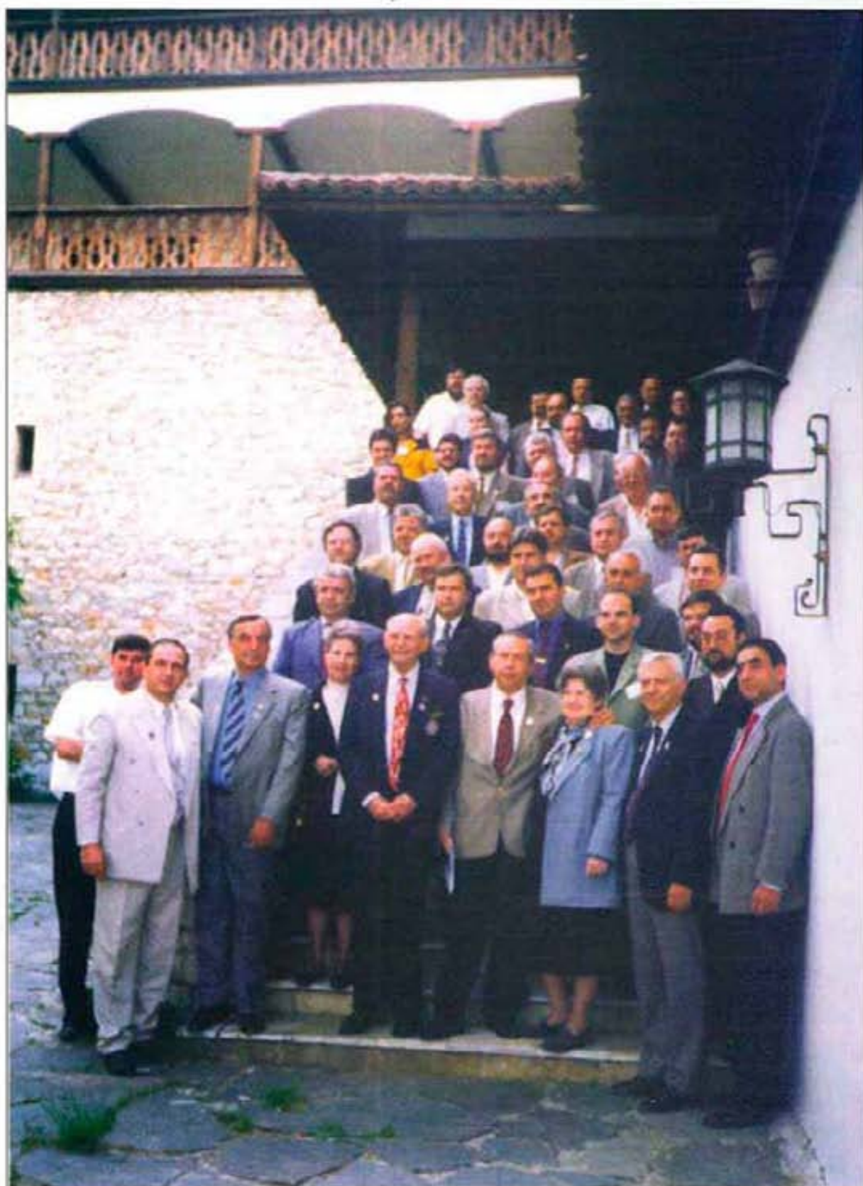
Участниците в ПЕТ семинара на дистрикта Асеновград, 14-16 май '99 г.