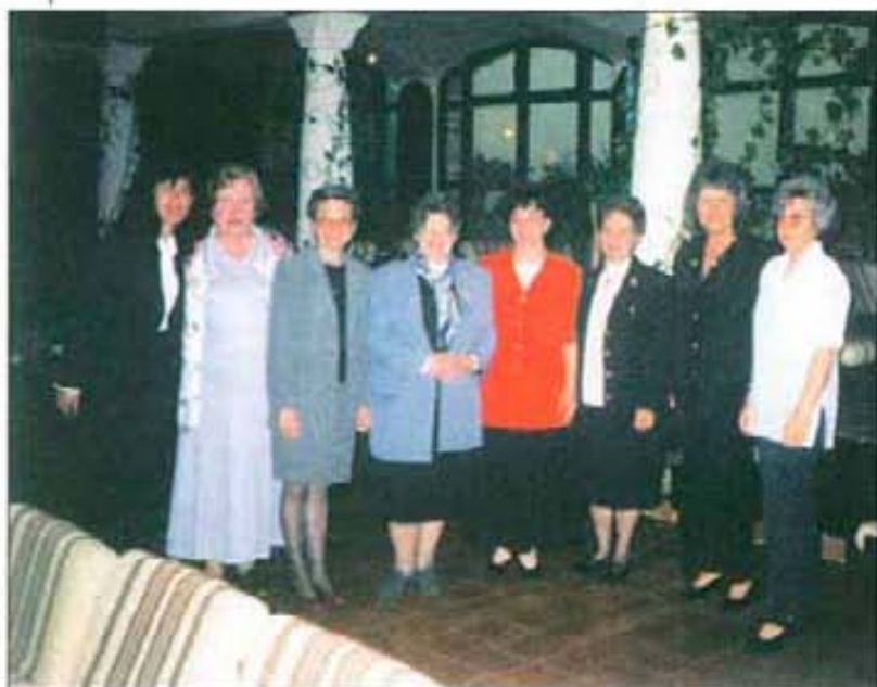
Представителките на Inner Wheel

над 600 гости, събрахме 5 млн. лв., които бяха поделени между сметката за храма и създадената от Ротари клуб фондация „Дарованията на Добруджа“. Чрез нея подпомагаме талантиливи деца в областта на музиката, културата, спорта. В града беше учреден обществен Съвет за борба с наркоманията. Това стана с изключителното съдействие и настояване от страна на нашия клуб. Предиизвикахме извънредна сесия на Общинския съвет, чиято единствена точка беше за борбата с наркоманията. Може би малко късно стана това, защото допуснахме две деца да станат жертва на наркотиците. Провеждаме редовно професионални срещи по специален график, одобрен от Борда на директорите. Бордът се събира задължително два пъти в месеца. В клуба в град Добрич царя добра приятелска атмосфера. Нашите жени учредиха Inner Wheel благодарение на помощта на жените на нашите приятели от Варна и Пловдив - получиха пакет документи от Inner Wheel от Англия, очакват чартиране. Наши деца влязоха във взаимовъздействие с членове на Ротаракт - Варна, посещават клуба и имат голямо желание да създадат клуб Ротаракт и в Добрич.