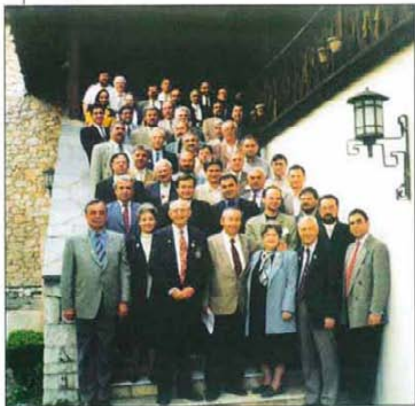
Участниците в конференцията